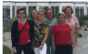
Bestyrelsen 2019 Vi

Tilmeld dig FB-gruppen riv-regh, vi er lige nu 331 med i gruppen, men der er plads til flere. På FB- gruppen og på hjemmesiden opdateres andre tilbud, når der er nyt.